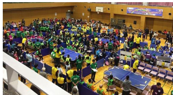
希望郷いわて大会の様子／ふれあいランド岩手 (H28.10.23)

今回の会場は北上市のサンレック北上。盛岡市以外では初めての大会開催であった。また、これも初めての試みであるが、参加資格は、障がいの有無を問わないバリアフリールールとした。この理由として、地域での開催は、比較的小規模の参加数を見込まれるため、バリアフリールールを適用することで福祉関係者と一般団体やスポーツ振興に携